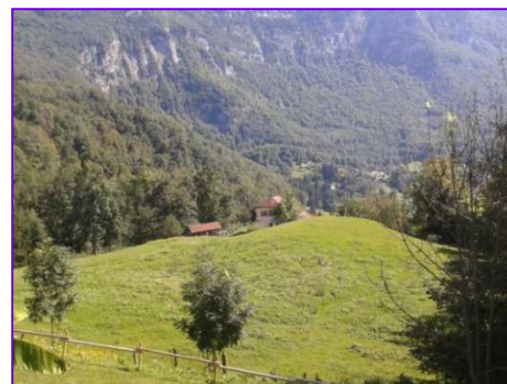
Le terrain du futur lotissement