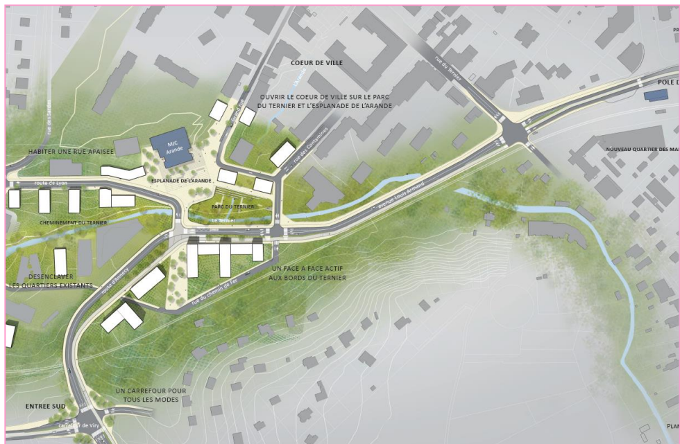
Gautier + Conquet