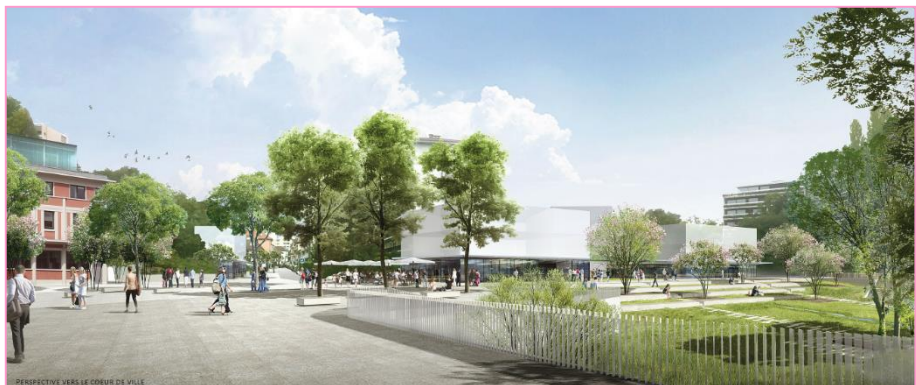
Gautier + Conquet