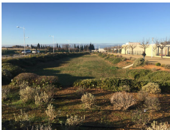
Photo du bassin BR2c