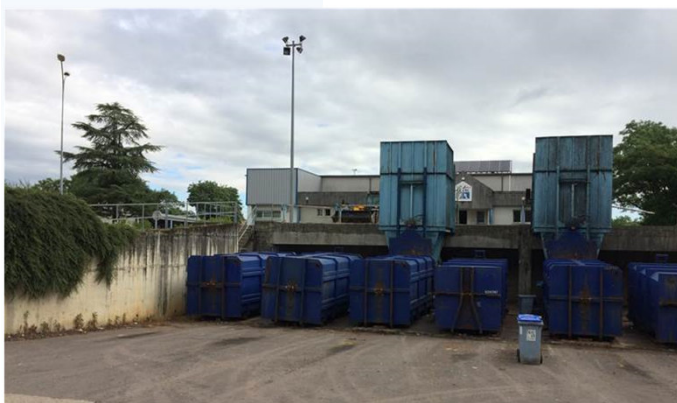
Accouplement compacteur/caisson Site de POLIGNY le 30-06-2017