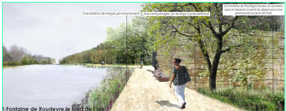
2-Fontaine de Roudeyre le long de l'Isle