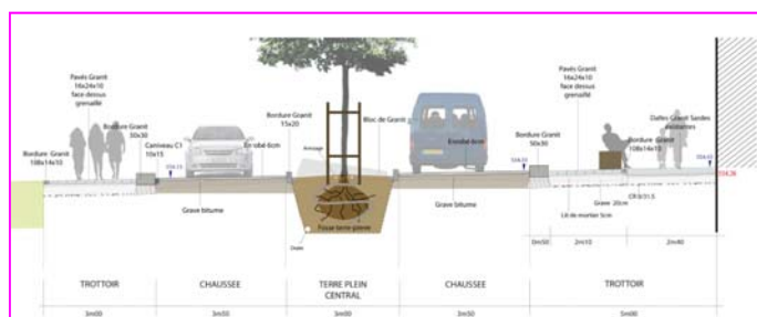
Coupe de principe au droit de la Place Charles Albert