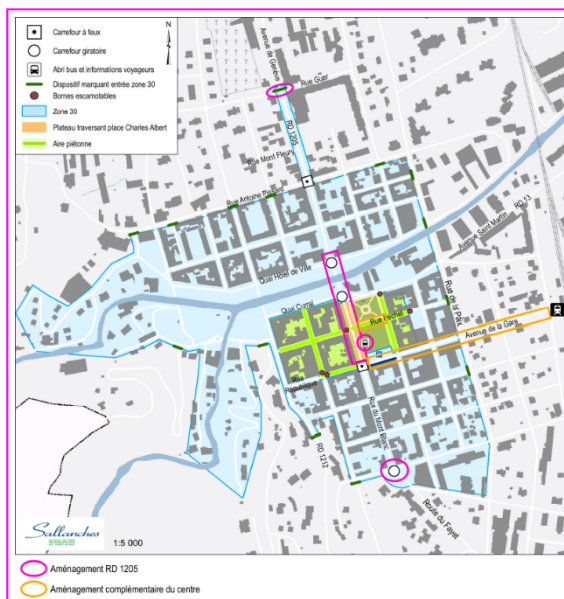
Phase 1 des travaux – Extrait du programme

Cette première phase d'étude et de travaux est la pierre angulaire d'un vaste projet qui permettra de redonner un souffle au cœur de ville.