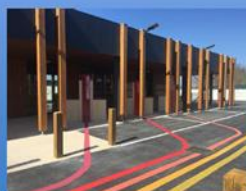
Super marché inversé du SMICVAL (Vayres (33))