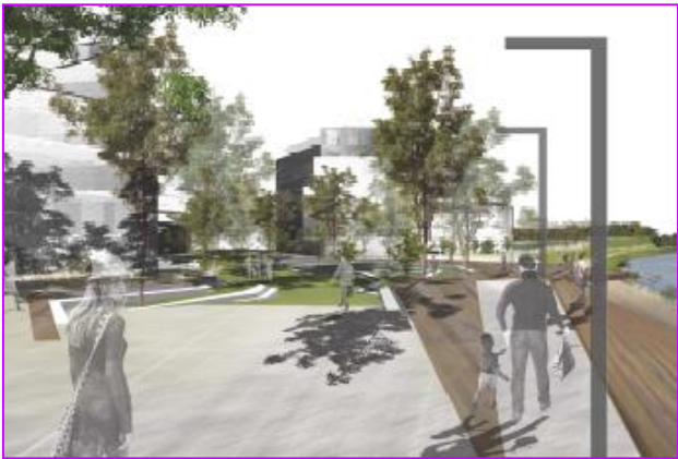
Promenade aménagée en rive du Lez