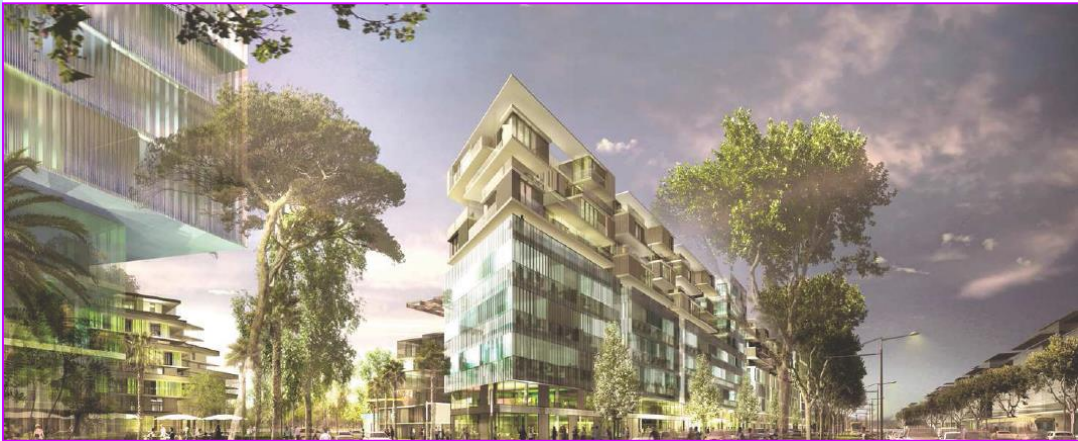
Perspective sur l'avenue Raymond Dugrand.