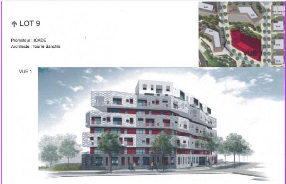
Une des particularités : l'orientation des logements en fonction de la course du soleil pour un confort maximal.